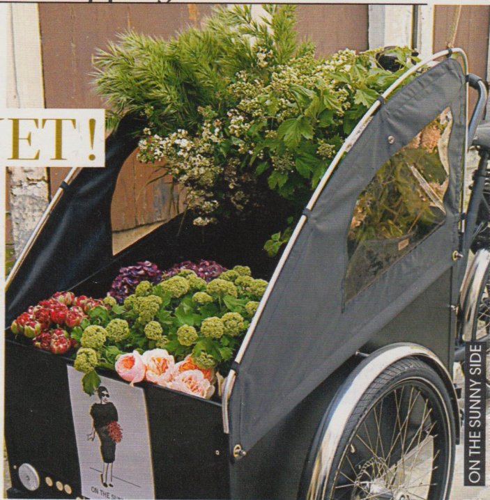
ON THE SUNNY SIDE

LE CONCEPT : le designer floral crée des robes en fleurs et autres pièces arty, mais également de